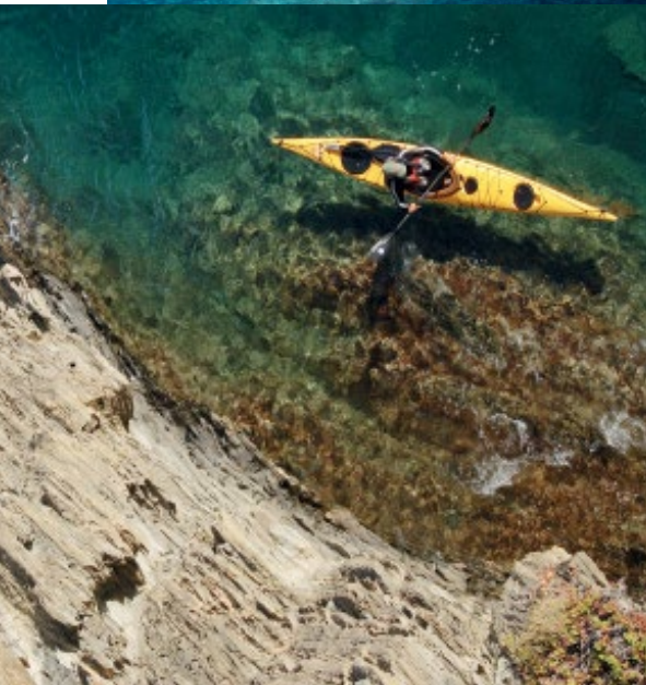
Aixiu Imatges PTCEBG

ma de pequeños pueblos medievales como Monells , con su preciosa plaza porticada, o Peratallada , un embrollo de calles serpenteantes que comunican la plaza mayor y la muralla; o en el poblado íbero de Ullastret , con sus atalayas defensivas y el museo que explica la vida de esta civilización en el siglo VI a.C. Dejando para otra ocasión La Bisbal d'Empordà y Pals (ver reportaje 2), ponemos dirección al Mediterráneo, a ese que baña los pueblitos de la Costa Brava y que marcó la vida y la obra de Salvador Dalí: Cadaqués, Portlligat y el Cap de Creus , escalas obligatorias de este triángulo daliniano en tierras ampurdanesas. Desde la cima del castillo de Torroella de Montgrí , en la montaña de Montgrí, a donde se llega tras una caminata por un sendero en alrededor de una hora, la vista alcanza a divisar toda la comarca. Se ven hasta las Illes Medes , los siete islotes declarados reserva de flora y fauna marinas, que son todo un parque de atracciones para submarinistas en el que pueden