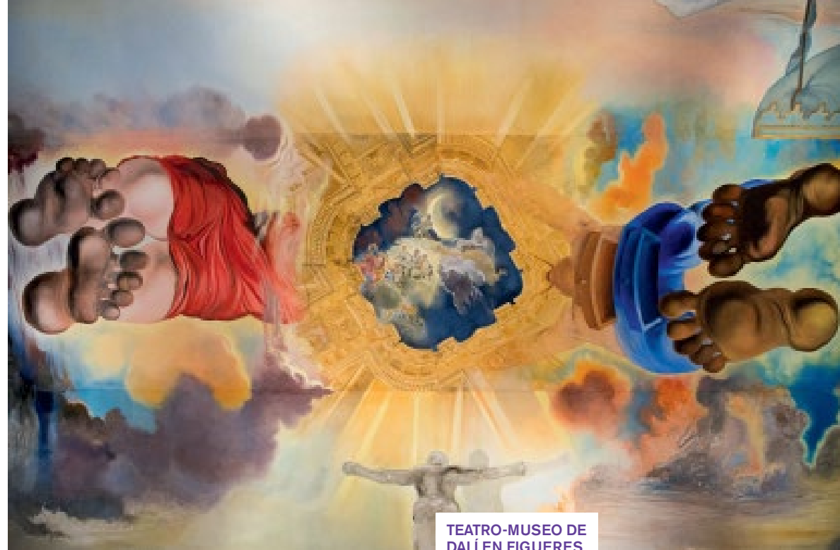
TEATRO-MUSEO DE DALÍ EN FIGUERES

ARRIBA: cúpula y una de las salas del Teatre-Museu Dalí. IZDA.: exterior del museo, la Sala Mae West. DCHA.: la obra Cadillac lluvioso , en el patio al aire libre.