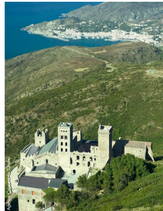
Agencia Catalana de Turismo

ma de pequeños pueblos medievales como Monells , con su preciosa plaza porticada, o Peratallada , un embrollo de calles serpenteantes que comunican la plaza mayor y la muralla; o en el poblado íbero de Ullastret , con sus atalayas defensivas y el museo que explica la vida de esta civilización en el siglo VI a.C. Dejando para otra ocasión La Bisbal d'Empordà y Pals (ver reportaje 2), ponemos dirección al Mediterráneo, a ese que baña los pueblitos de la Costa Brava y que marcó la vida y la obra de Salvador Dalí: Cadaqués, Portlligat y el Cap de Creus , escalas obligatorias de este triángulo daliniano en tierras ampurdanesas. Desde la cima del castillo de Torroella de Montgrí , en la montaña de Montgrí, a donde se llega tras una caminata por un sendero en alrededor de una hora, la vista alcanza a divisar toda la comarca. Se ven hasta las Illes Medes , los siete islotes declarados reserva de flora y fauna marinas, que son todo un parque de atracciones para submarinistas en el que pueden