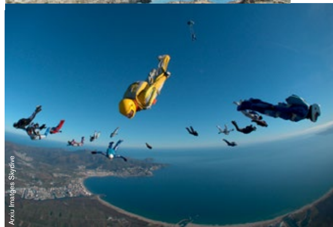
Aixiu Imatges Skydive