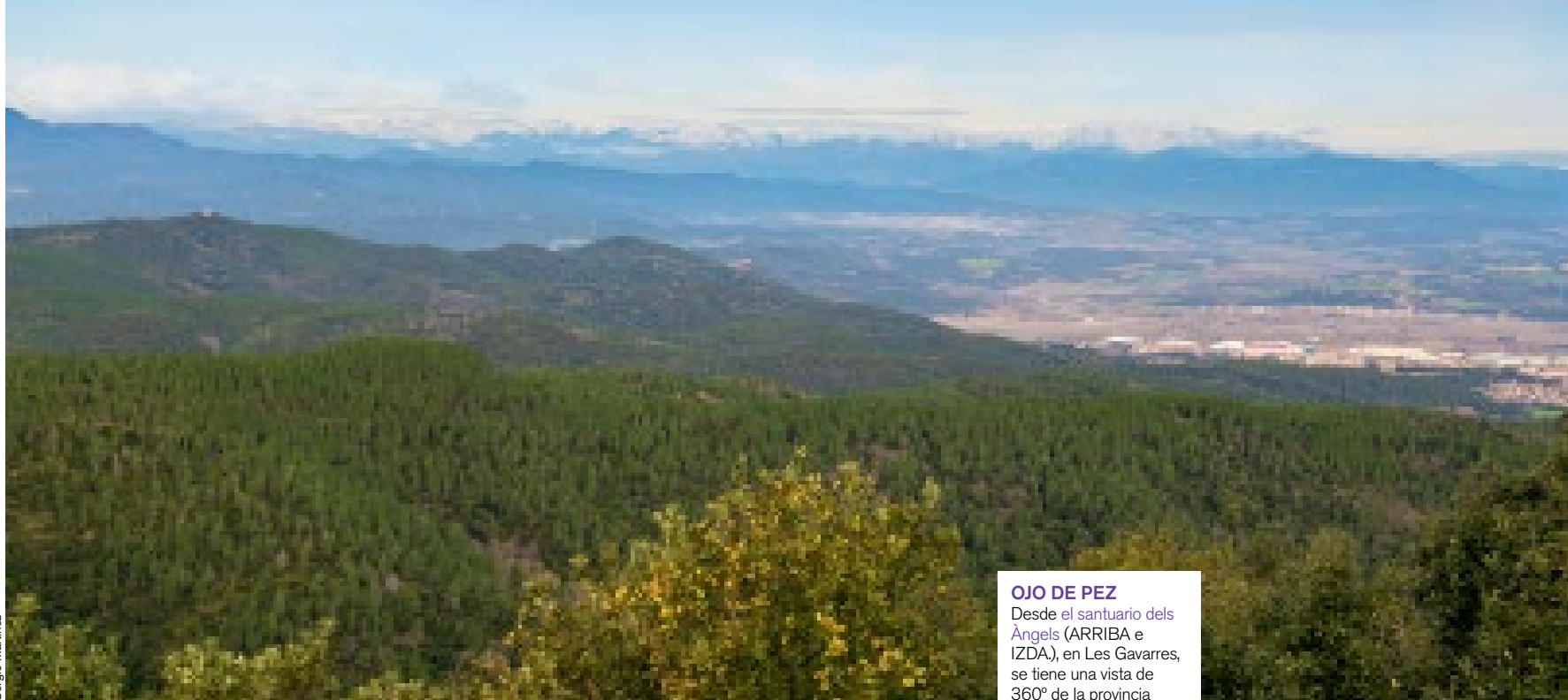
OJO DE PEZ Desde el santuario dels Àngels (ARRIBA e IZDA), en Les Gavarres, se tiene una vista de 360° de la provincia desde L'Empordà hasta los Pirineos, e incluso el Mediterráneo. Por la noche es la cúpula celestial la que abarca un horizonte infinito.