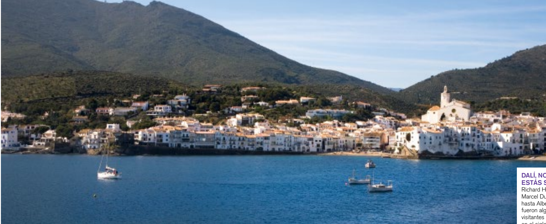
Álex del Río