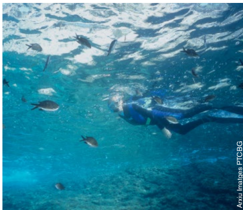
Aixiu Imatges PTCEBG